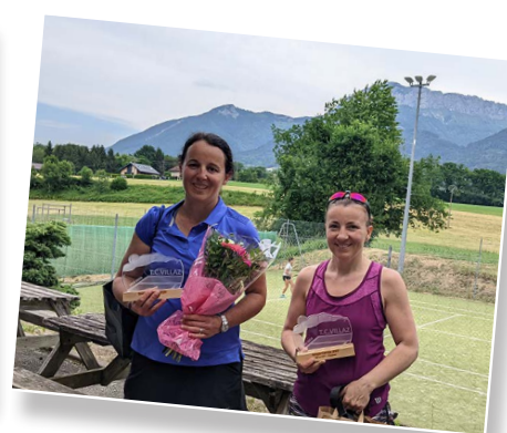
Tournoi du Tennis Club de Villaz : les 4 demi-finalistes femmes et hommes, les 2 finalistes femmes.