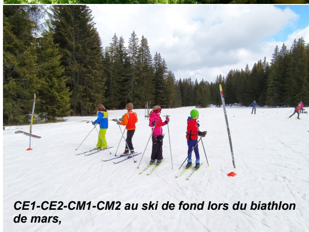
CE1-CE2-CM1-CM2 au ski de fond lors du biathlon de mars,