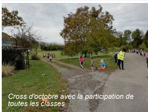
Cross d'octobre avec la participation de toutes les classes