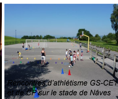
Rencontres d'athlétisme GS-CE1 et de CP sur le stade de Nâves