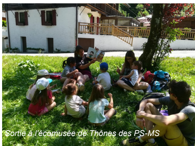
Sortie à l'écomusée de Thônes des PS-MS