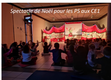
Spectacle de Noël pour les PS aux CE1