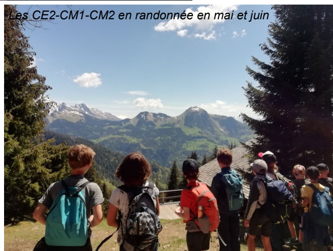
Les CE2-CM1-CM2 en randonnée en mai et juin