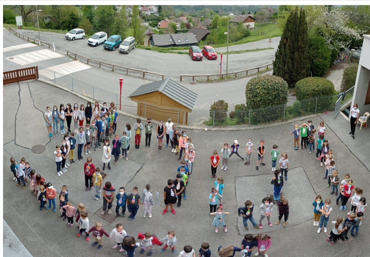
Les 100 jours avec toutes les classes